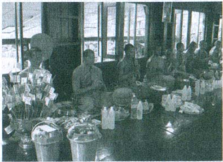
งานทำบุญถวายหลวงพ่อสาย วัดท่าขนุน มีทุกวันที่ ๑๔ ของเดือน แต่งานใหญ่จริงๆ ต้อง ๑๔ กันยายน ของทุกปี

พระครูธรรมธรเล็ก สุขุมมปัญญา วันเสาร์ที่ ๒๗ ธันวาคม ๒๕๔๖